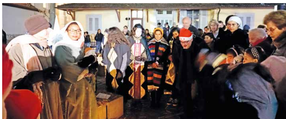
Les 15 et 16 décembre derniers, à Meyrin village, le spectacle NOËL en plein vent a été donné sur la place, à Meyrin Village, devant une nombreuse assistance.