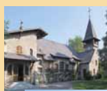
SAINTS-PIERRE ET PAUL (SATIGNY)