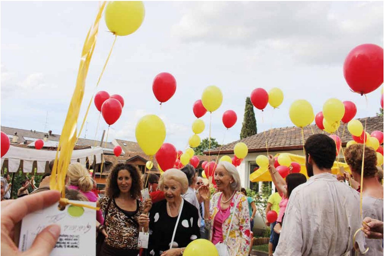
Fête de famille à la Résidence Nant-d'Avril. Cette fête qui a lieu chaque année s'est terminée cette année par un lâcher de ballons.