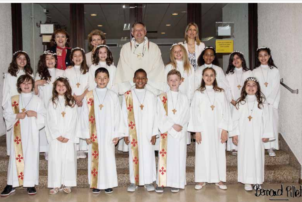
Les enfants de Meyrin, de Saint-Julien et de la Visitation, le jour de leur première communion à l'église de la Visitation.