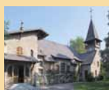
SAINTS-PIERRE ET PAUL (SATIGNY)