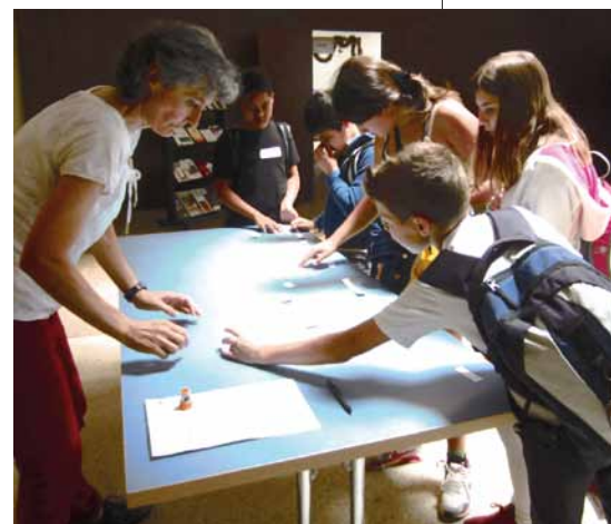
Après avoir donné leurs propres réponses les enfants se sont intéressés aux recherches pour trouver la véritable signification des jours de fêtes.

Propos communiqués par Bernhard Duss et son équipe