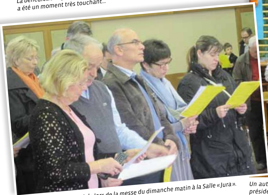
La Communauté paroissiale lors de la messe du dimanche matin à la Salle «Jura».