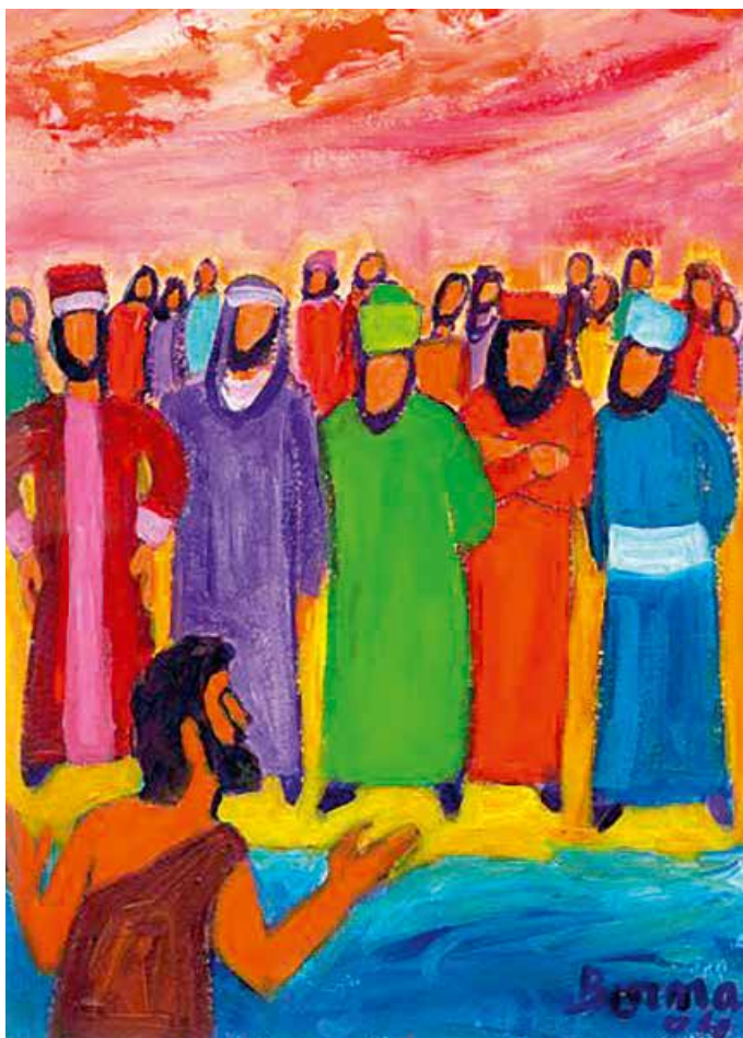
PAR CLAUDE BAECHER

Invitation à la journée de ressourcement œcuménique du samedi 11 mars 2017 entre les trois paroisses catholique de la Visitation, protestante et évangélique de Meyrin. La rencontre se déroulera au Centre international John Knox (27 Chemin des Crêts de Pregny, 1218 Grand Saconnex) de 9h à 16h.