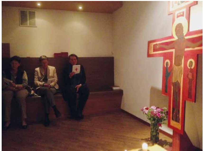
Une petite partie du groupe réuni dans la chapelle de l'Emmanuel, autour de la croix de Taizé, le 30 avril.

Au début de cette année nous avons proposé de nous élargir aux dimensions de notre UP. C'est ainsi que nous sommes venus animer une veillée de prière au centre œcuménique