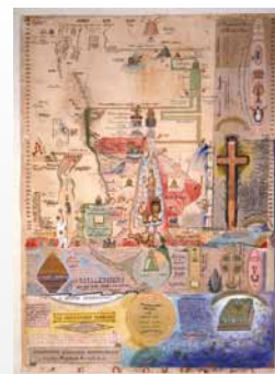
Henry Dunant, Diagramme symbolique chronologique de quelques prophéties des Saintes-Ecritures, env. 1890

Exposition organisée par The Menil Collection, Houston Avenue de la Paix 17, Genève Jusqu'au 3 janvier 2016