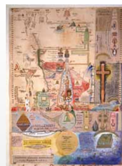
Henry Dunant, Diagramme symbolique chronologique de quelques prophéties des Saintes-Ecritures, env. 1890

Exposition organisée par The Menil Collection, Houston Avenue de la Paix 17, Genève Jusqu'au 3 janvier 2016