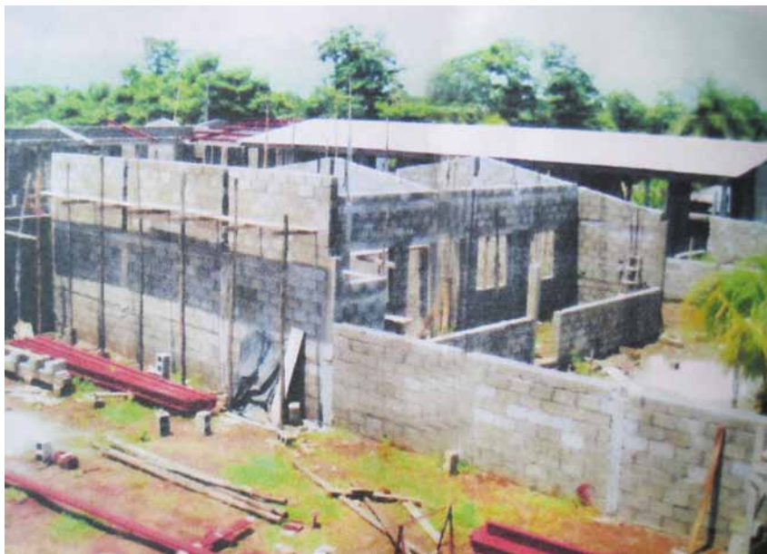
La nouvelle école supérieure et extérieure de La Blanca-Ocos en construction.

La sécurité est tout à fait absente. Cette année 113 pilotes et aidants de bus urbains ont été assassinés. Il y a plus de police privée que la nationale, à cause de très nombreuses extorsions: votre argent ou la vie (insécurité). Ici à