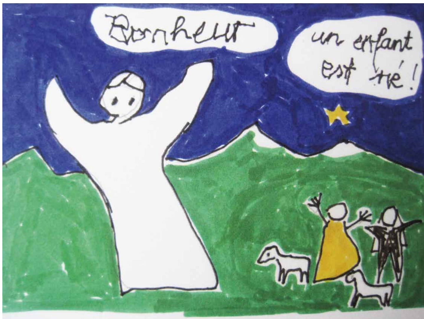
L'ange qui annonce la joie. (Luc 2, 8-14)