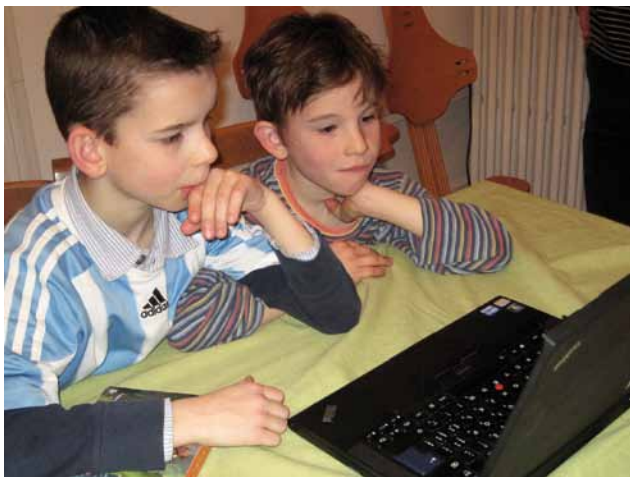
Deux enfants (11 et 9 ans) complètement absorbés par l'ordinateur familial...

Parce qu'il y a quasiment tout / Pour retrouver des amis sur Facebook / Car ça m'amuse / Parce qu'on peut regarder des matchs ou des vidéos de foot / Parce qu'il y a des jeux / Car il y a plein de trucs cool / Car c'est cool!!!