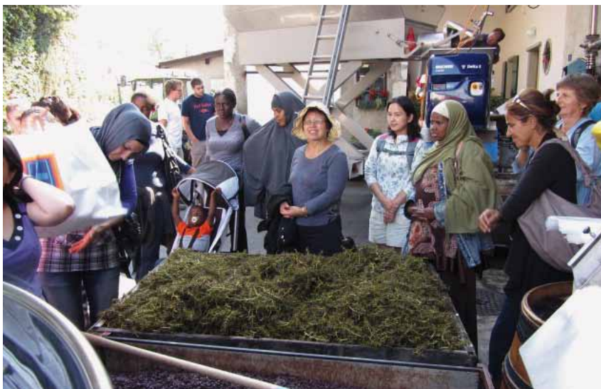
Visite d'une ferme de la région au moment des vendanges.

La majorité des participantes arrivent au CEFAM avec le besoin d'apprendre le français. Elles sont accueillies dans un des cours de base, donnés par des enseignantes professionnelles, secondés par des bénévoles. Les besoins sont variés, allant de l'alphabétisation à des niveaux plus avancés de lecture et de conversation. Certains cours ont lieu dans des écoles primaires de Meyrin (Boudines et Bellavista) et forment «les classes des mamans». Elles offrent aux mamans une occasion de faire un lien avec le système scolaire pour mieux épauler leurs enfants pendant leur scolarité.