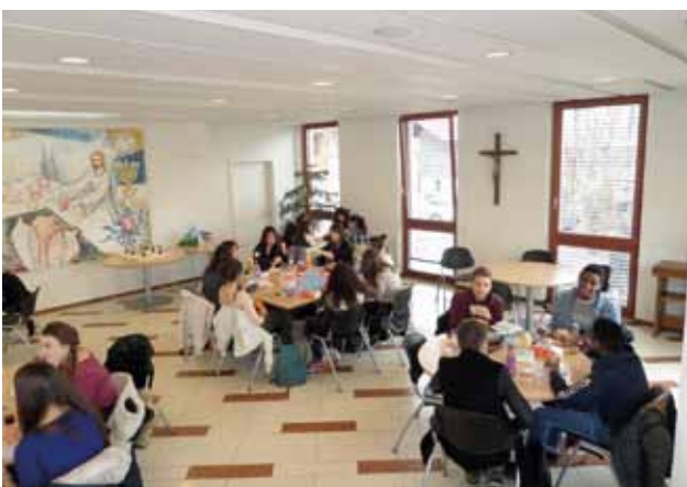
Ambiance studieuse pour la réflexion en groupes avant la discussion et le repas canadien.