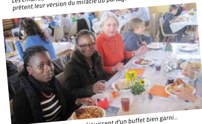
Jeunes et moins jeunes se réjouissent d'un buffet bien garni...