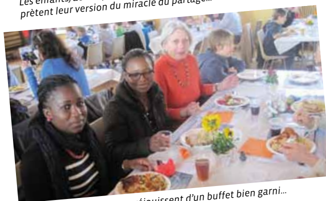
Jeunes et moins jeunes se réjouissent d'un buffet bien garni...