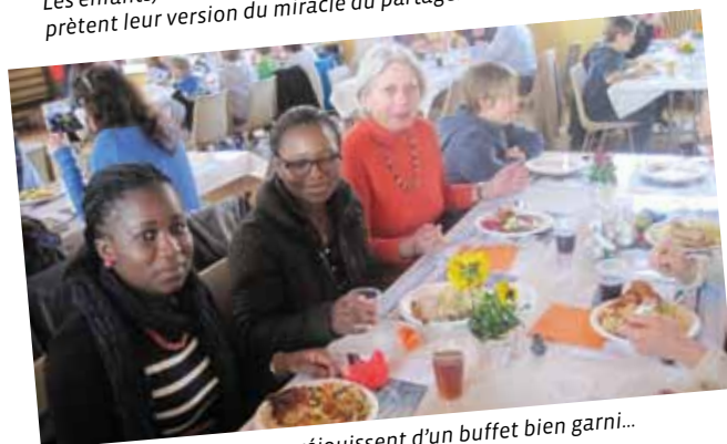
Jeunes et moins jeunes se réjouissent d'un buffet bien garni...