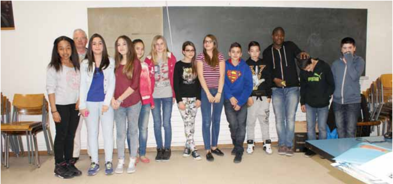
Un groupe plein de vie qui a bien du mal à rester tranquille... même pour la photo!

Le groupe de catéchèse des élèves du C.O. existe. Il est prévu pour les jeunes en 9 e et 10 e années de scolarité qui veulent approfondir leurs connaissances religieuses initiées durant quatre ou cinq ans à la Visitation et à Saint-Julien. Actuellement il compte une vingtaine de jeunes garçons et filles des paroisses de Saint-Julien et de la Visitation. Pour ces jeunes de 12 à 15 ans, la catéchèse s'adapte à la période de mutation que vit l'adolescent ou l'adolescente afin de lui permettre le passage à une foi personnelle. Ce cours a lieu un vendredi par mois, dans la salle polyvalente du C.P.O.M. (Visitation). La matière vise les connaissances religieuses essentielles d'un chrétien. Une année nous avons étudié la Bible, sa composition, son histoire. Une