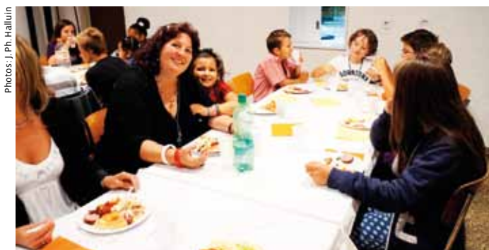
Le repas en famille