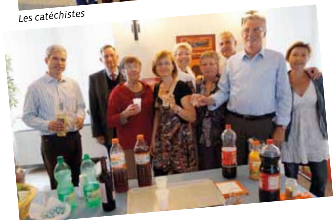
L'apéro entre amis